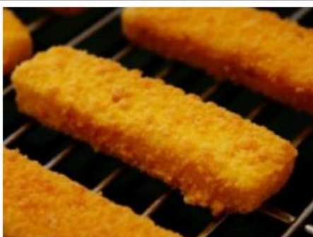
Fish Sticks Iglo

Op de middag van 15 augustus verdwenen in het Kattenbos in Lommel een onbekend aantal fish sticks van het merk Iglo. Op het moment van hun verdwijning droegen ze een goudbruin jasje van paneermeel en zaten ze samen in een koningsblauwe doos. Moest u hen gezien hebben of een tip hebben in verband met hun verdwijning, mag u steeds contact opnemen met de Stam.